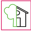
Indoor / Outdoor